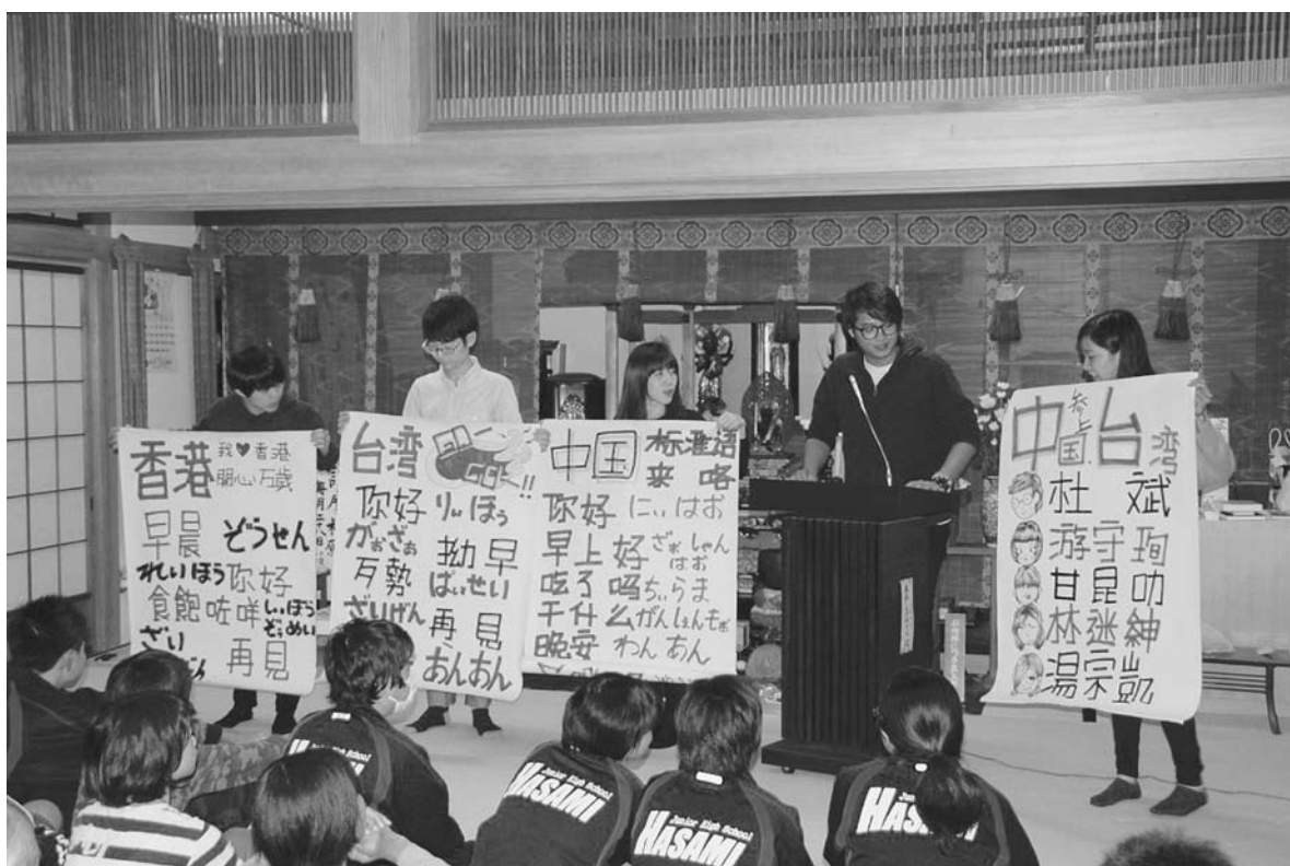
写真1 留学生によるミニ語学講座 (2014年10月29日章撮影)