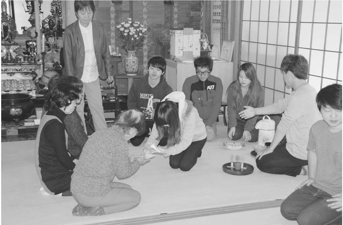
写真2 留学生によるミニ茶会（2014年10月30日）

留学生にとっても地域の方々にとっても、本プログラムはまさに「一期一会」の貴重な機会であり、その重みを自覚しながら、お互いにとって有意義で楽しい交流機会をこれからも提供し続けていきたい。また、グローバル化の流れと共に、国境、世代を越えた人々のつながりを育み、同時に留学生たちの長崎に対する新たな見識および異文化理解をより一層深めることに寄与していきたい。